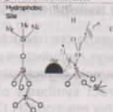
Fig.3 Probable reaction mechanism

Although for a long time bulk gold was regarded as a poorly active catalyst, gold nanoparticles (2-5nm) deposited on a variety of metal oxides are surprisingly active for many reactions. 7 The first typical example is low temperature CO oxidation over Au/Fe_2O_3 , which was commercialized in 1992. Another target for commercialisation using gold catalysts is PO synthesis. Direct vapor phase epoxidation of propylene with O_2 and H_2 over gold nanoparticles on TiO_2 was first reported by Haruta's group 8 Since then tremendous efforts have been dedicated to improve these gold catalysts' performance by employing different modified titanosilicate materials and synthetic conditions among others. Recently we have invented metal nitrate promoted mesoporous titanosilicate supported gold catalyst which will be commercialised soon to set an example of an industrial process where gold plays an important role to provide important chemical to the mankind 9 (Probable reaction mechanism shown in the picture)