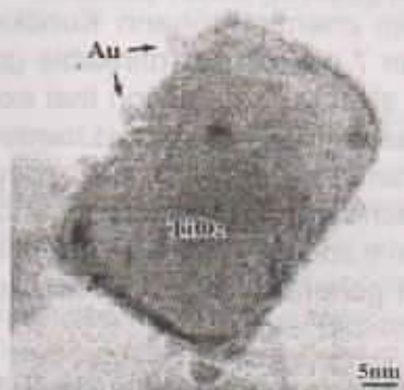
Fig.2 TEM picture of Gold Nanoparticles on TiO_2

regarded as a holy grail in the field of catalysis science and technology, but to date an efficient gas-phase synthesis has proved elusive. 6